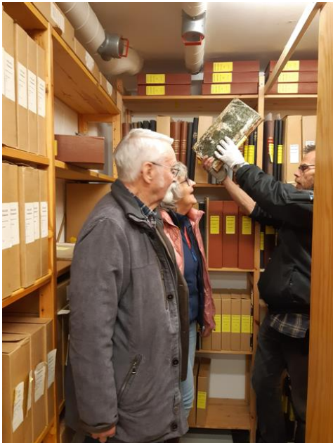
Avskriftsgrupp på besök i Strömsunds kommunarkiv.

Under hösten startades med hjälp av dessa medel en avskriftsgrupp i Strömsund under ledning av Carina Strömberg. De har träffats på biblioteket och har startat med läsövningar och gör avskrifter av arkivmaterial. Gruppen har gjort ett studiebesök på Arkivet i Östersund och ett på Kommunarkivet i Strömsund. På träffarna förs samtal om både släktforskning och historia och man fikar tillsammans. Det har varit 10 deltagare i gruppen som har träffats åtta gånger, varav två gånger var studiebesök. Nio handböcker i handskriftsläsning har delats ut till deltagarna, och ett exemplar skänktes till biblioteket i Strömsund. Träffarna görs i samarbete med Studieförbundet vuxenskolan.